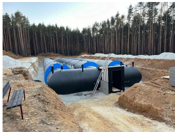
Die drei Rohre knapp vor der Fertigstellung.

Die Einweihung rundete eine Präsentation mit den wichtigsten Details und Fotos ab. Wir danken für die Möglichkeit, dass wir dieses Projekt von beeindruckender Dimension hautnah erleben durften.