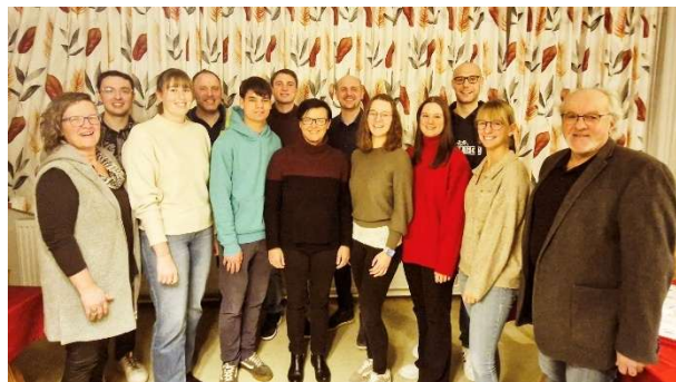
Der neu gewählte Vorstand der Trachtenkapelle

Mit diesem kurzen Ausblick hofft die Trachtenkapelle Haßbach-Penk-Altendorf, Ihnen, liebe Leserinnen und Leser, ein schönes musikalisches Jahr 2025 bereiten zu können.