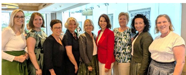
Bürgermeisterinnen aus unserer Region und unserem Bezirk

Neu ist, dass auch Vizebürgermeisterinnen teilnahmen, die zu Führungsaufgaben ermutigt werden sollten.