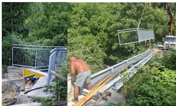
Einbauten der EVN, nÖGIG und A1-Telekom

Die Brücke ist nun sicher und wieder bereit für den täglichen Gebrauch.