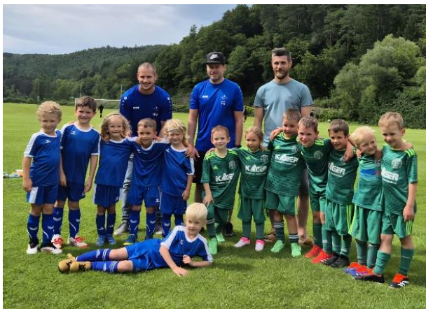
Fußballkindergarten des USV und aus Pitten

Das diesjährige Grillfest des FC Kirchau war ein großartiger Tag voller Spaß, Essen und natürlich Fußball.