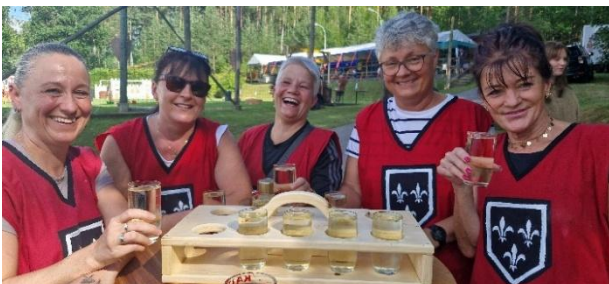
Frauenrunde aus Haßbach

Mitte Juli fand das alljährliche Sommerfest der Trachtenkapelle Haßbach-Penk-Altendorf statt. Die Veranstaltung, die am Samstag und Sonntag in Gramatl, stattfand, zog zahlreiche Besucher aus der Region an und bot ein abwechslungsreiches Programm für Jung und Alt.