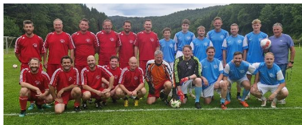
Die Verheirateten und die Ledigen

Der USV Scheiblingkirchen-Warth ist mit der KM 2 gegen Natschbach-Loipersbach angetreten.